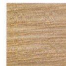
オーク突板 (マット)