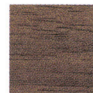
ウォールナット 突板(マット)