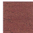
オクメ突板 (グロス)