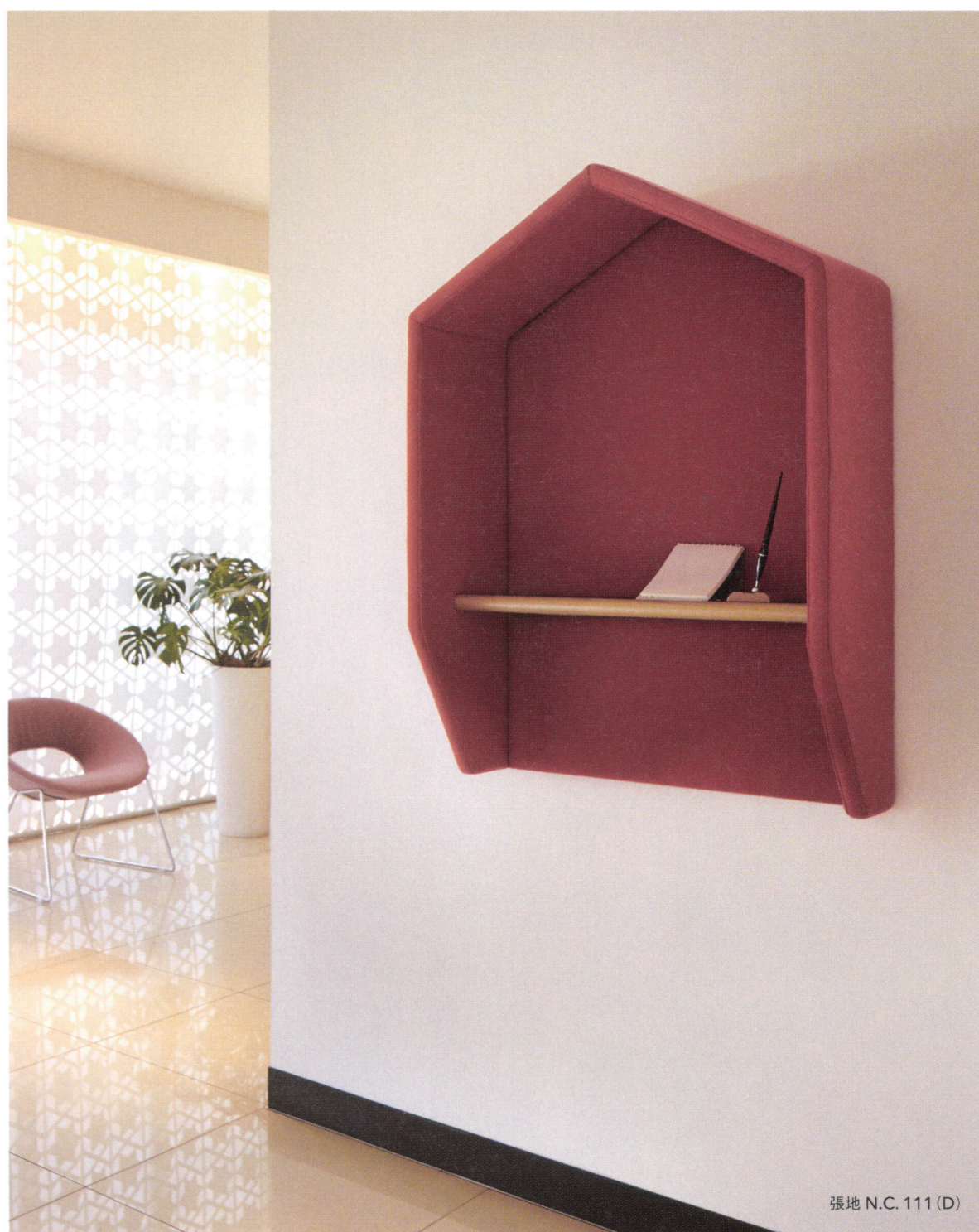
張地 N.C. 111 (D)