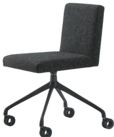
張地 モック 205 (A)