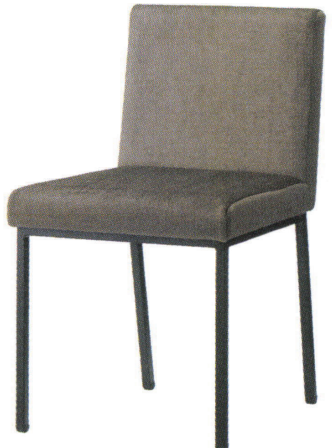
張地 スピリットAC UP5557 (E)