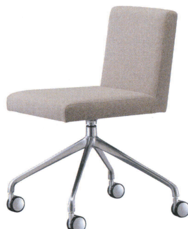
張地 モック 304 (A)