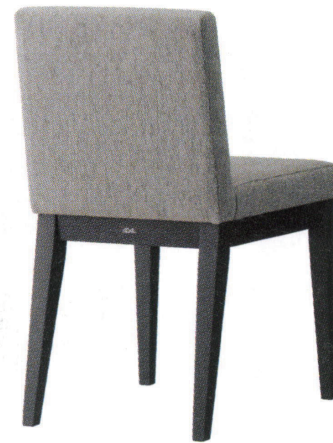
張地 ファルベ GR(D)