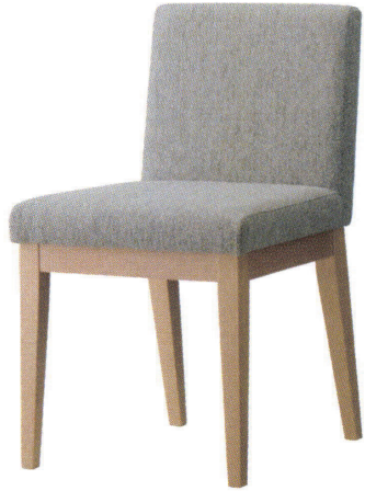
張地 ファルベ GR(D)