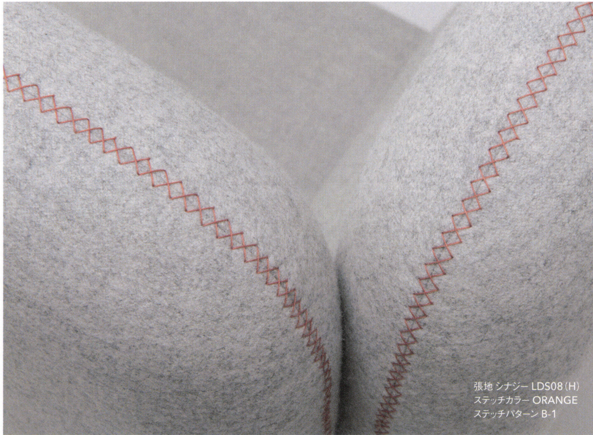
張地 シナジー LDS08(H) ステッチカラー ORANGE ステッチパターン B-1

トフィーは特殊なミシンの採用で、意匠性に富んだデザインステッチが施されています。