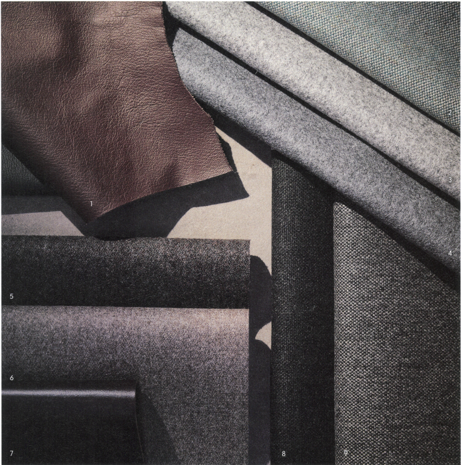
1. 本革 HRL-02 2. メインラインフラックス MLF24 3. プレイザー CUZIE 4. プレイザー CUZIJ 5. シナジー LDS34 6. シナジー LDS33 7. 本革 HRL-07 8. メインラインフラックス MLF28 9. メインラインフラックス MLF16